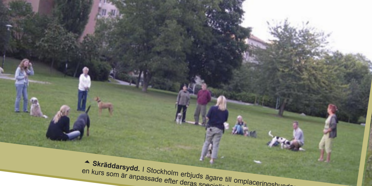
▲ Skräddarsydd. I Stockholm erbjuds ägare till omplaceringshundar en kurs som är anpassad efter deras speciella behov.