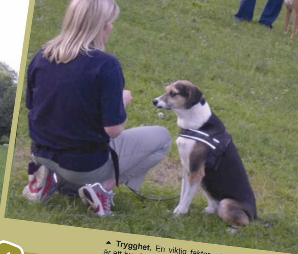
▲ Trygghet. En viktig faktor på kursen är att hunden ska känna sig trygg.