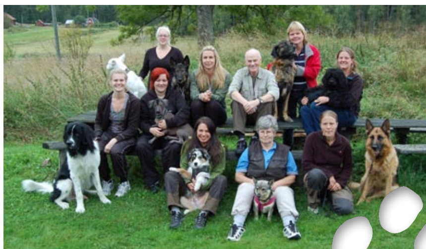
Deltagarna samlade efter en lyckad kurs.

Dogma kommer snart också att släppa programmet »Änglavakt«. Tanken är att hundar som har utbildats i brandvarning ska få en utmärkelse i form av en bronsknapp att fästa vid halsbandet. De hundar