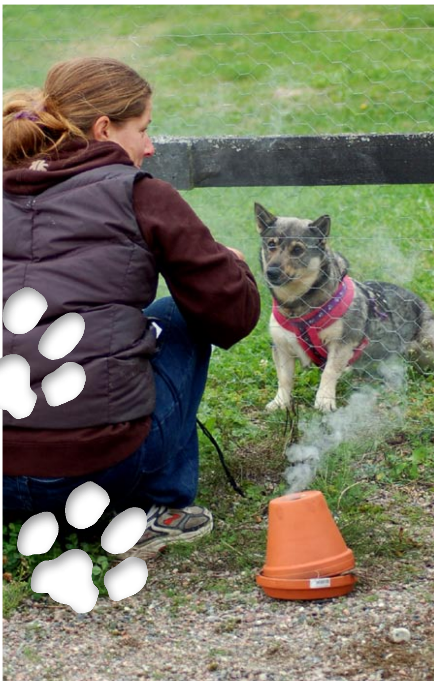
Kursen ger matte och hund tillfälle att både leka och lära.

Hunden är människans bästa vän sägs det. Nu kan husse och matte lära familjens kelgris att varna för brand redan innan brandvarnaren hunnit gå igång.