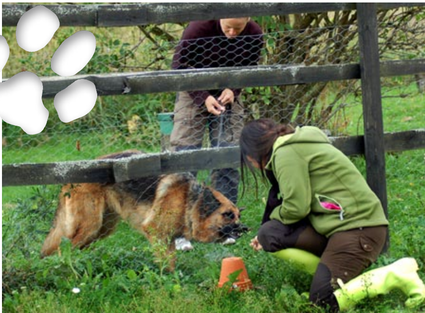
Lite hundgodis smakar gott efter övningarna. Med lek och glädje lär sig hundarna att markera för rök.